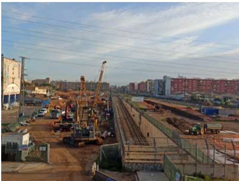
Imagen desde puente sobre las vías en la Avda. Fernando Abril Martorell Vista hacia Valencia Nord

Durante el encuentro, Adif Alta Velocidad ha informado del desarrollo de los trabajos que comenzaron el pasado 6 de febrero. Tras las primeras actuaciones de topografía, gestión y modificación de los servicios afectados, ejecución de sondeos complementarios y movimiento de tierras, comenzó la construcción de los muros de pantalla que conformarán el canal de acceso y se ha iniciado el desvío de la línea de alta velocidad.