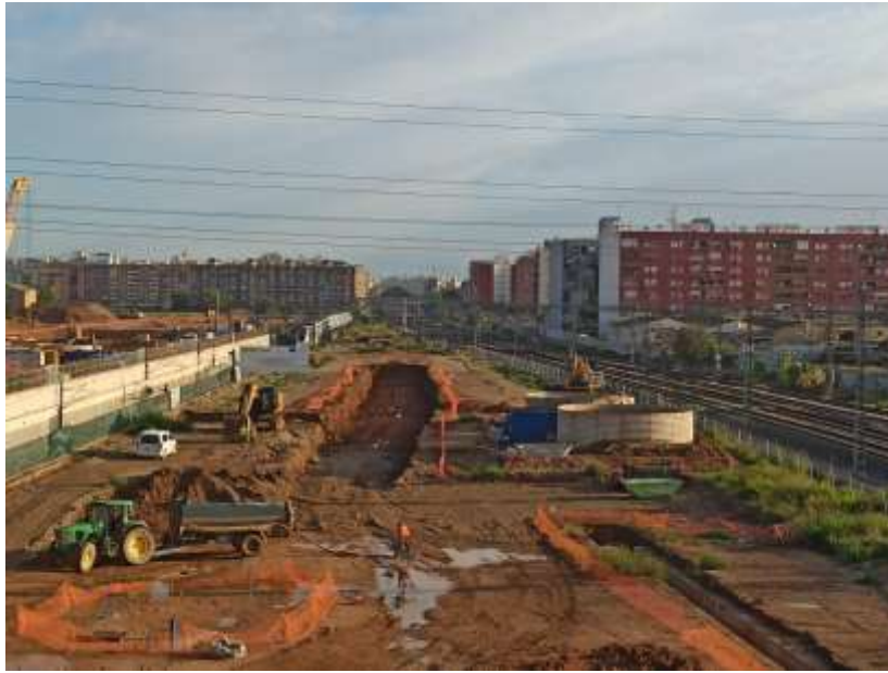
Imagen desde puente sobre las vías en la Avda. Fernando Abril Martorell Vista hacia Valencia Nord