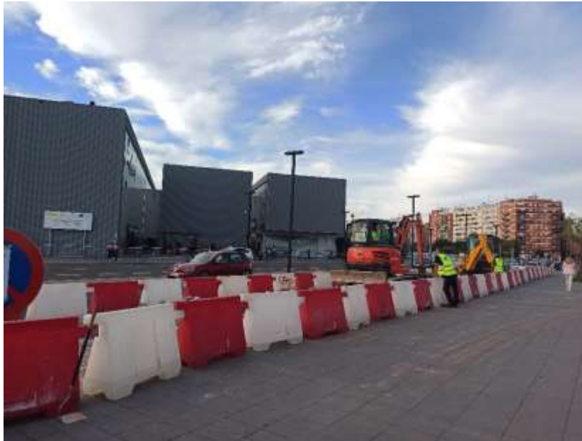
Trabajos en la mediana frente a la Estación Joaquín Sorolla

Las actuaciones del nuevo Canal de Acceso a València se desarrollan por fases en cinco años, incluyen la demolición del viaducto de Giorgeta y se han de compatibilizar con el tráfico ferroviario.